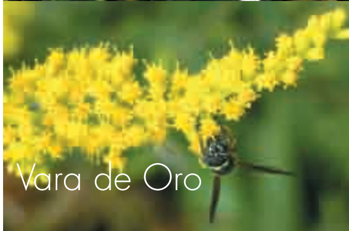
Vara de Oro