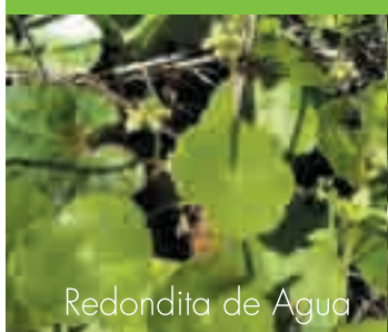
Redondita de Agua

Sagitaria ( Sagitaria ) Camalote ( Eichornia Sp. ) Cucharero ( Echinodorus Grandiflorus ) Repollito de Agua ( Pistia Stratiotes ) Redondita de Agua ( Hydrocotyle Bonariensis ) Lenteja de Agua ( Spirodela Intermedia ) Cola de Caballo ( Equisetum Giganteum ) Paja Brava ( Scirpus Gigantescus ) Lirio Amarillo ( Iris Pseudacorus )