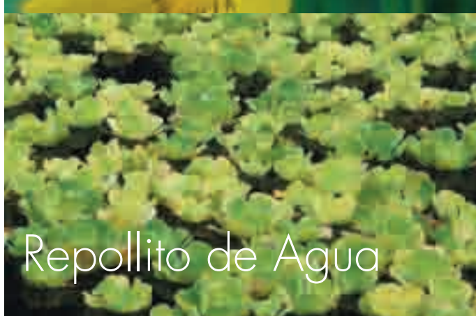
Repollito de Agua