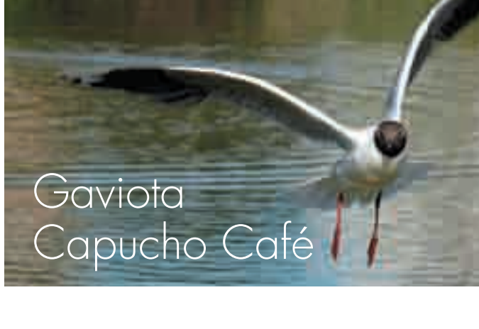
Gaviota Capucho Café