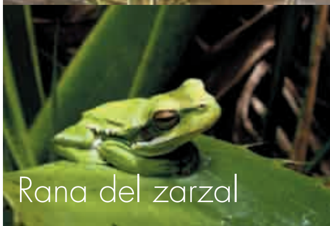
Rana del zarzal