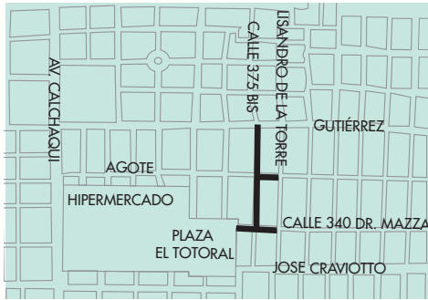
Asfalto inaugurado en enero en Quilmes Oeste

Por otra parte, continúa llevándose a cabo satisfactoriamente la ejecución del plan integral de bacheo en distintos puntos. Así, la intersección de las calles Gran Canaria y Olivieri, Mazza y 375 bis de Quilmes Oeste; Sarmiento entre Castelli y Paso, Sarmiento y Echeverría, y Primera Junta y Paz de Quilmes Centro; Liniers y Viejo Bueno de Bernal Oeste; San Martín y Belgrano, y San Martín y 882 de Solano, han sido habilitadas luego de las obras de bacheo que allí se realizaron con maquinaria y personal municipal.