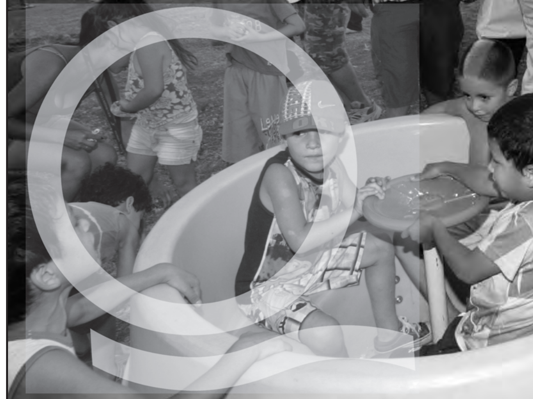
Chicos y chicas del barrio Namuncurá de Ezpeleta Oeste, jugando en la plaza homónima recientemente inaugurada.

BOLETÍN MENSUAL DE INFORMACIÓN PARA LAS VECINAS Y LOS VECINOS DE QUILMES AÑO 5 / NÚMERO 47 / FEBRERO DE 2012