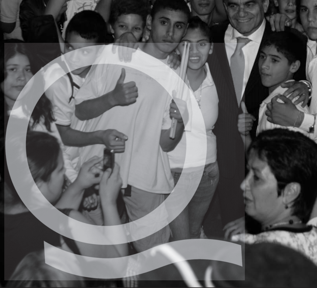
Un grupo de jóvenes saluda al intendente Francisco Gutiérrez luego de su reasunción. 12 de diciembre, Plaza San Martín, Quilmes.

BOLETÍN MENSUAL DE INFORMACIÓN PARA LAS VECINAS Y LOS VECINOS DE QUILMES AÑO 5 / NÚMERO 46 / ENERO DE 2012