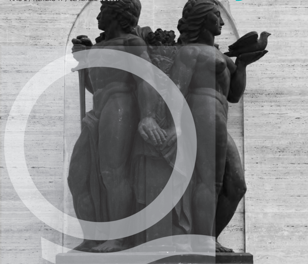
Detalle del Monumento a San Martín, en la plaza homónima. El primer nombre de la plaza –delimitada por las calles Rivadavia, Alsina, Mitre y Sarmiento, en el centro de Quilmes– fue «Plaza Mayor», y ya figuraba en el primer plano de Quilmes, trazado en 1818 por el agrimensor Francisco Mesura.

BOLETÍN MENSUAL DE INFORMACIÓN PARA LAS VECINAS Y LOS VECINOS DE QUILMES AÑO 2 / NÚMERO 19 / SEPTIEMBRE DE 2009