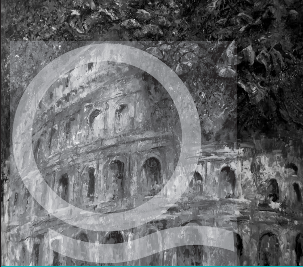
Primer premio del Salón Nacional de Pintura, Quilmes 2011. El cuadro pertenece a Víctor Fernández. La muestra completa se inaugura el 19 de agosto a las 20 hs. en el Museo Municipal de Artes Visuales Víctor Roverano.

BOLETÍN MENSUAL DE INFORMACIÓN PARA LAS VECINAS Y LOS VECINOS DE QUILMES AÑO 4 / NÚMERO 41 / AGOSTO DE 2011