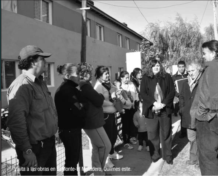
Visita a las obras en el Monte-El Matadero, Quilmes este.

El intendente recorrió las obras de vivienda que se están realizando en el partido