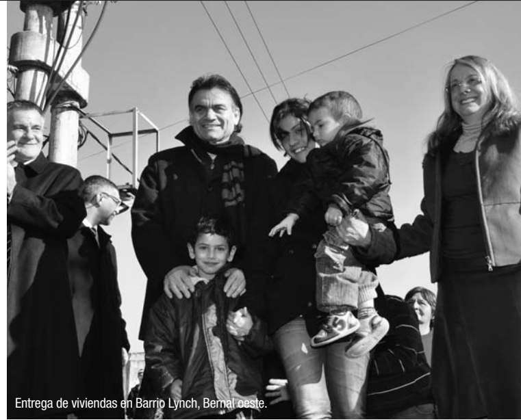
Entrega de viviendas en Barrio Lynch, Bernal Oeste.

LA MATERA 1 Y 2. El intendente Gutiérrez visitó las obras que se están realizando en el barrio La Matera, que comprenden la construcción de 150 viviendas (que se suman a las 316 que ya fueron entregadas), los asfaltos de la 816 y la construcción de 3 conductos pluviales de 400 metros cada uno. «Estamos contentos por el avance del barrio –sostuvo Gutiérrez–. Cuando comenzamos la gestión hicimos una asamblea junto con todos los vecinos. Les planteamos que nuestro objetivo era impulsar el desarrollo del barrio, la terminación de la escuela y el jardín, también la Sala de primeros auxilios, que ahora se va a transformar en un centro comunitario muy amplio. Allí habrá espacios para talleres barriales, tareas comunitarias y sociales. Los asfaltos permitirán que bomberos, patrulleros, ambulancias puedan entrar y salir».