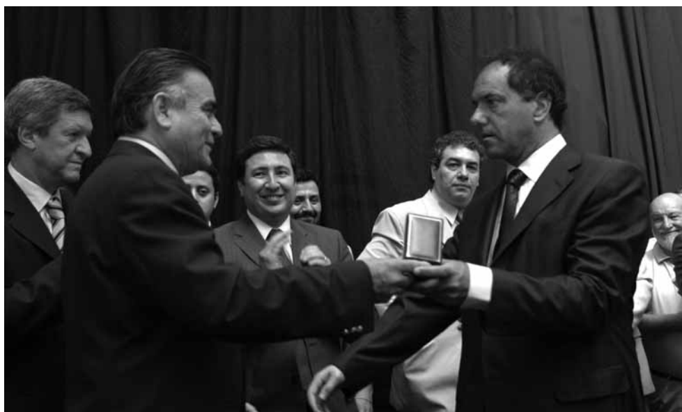
El intendente le entrega al gobernador de la Provincia de Buenos Aires, Daniel Scioli, la medalla de visitante ilustre de Quilmes.

El gobernador Scioli visitó el palacio municipal junto a sus ministros, y con el intendente recorrieron una agenda de temas de relevancia para Quilmes, como las napas, cloacas, viviendas, parque industrial, ensanchamiento de Camino General Belgrano y Lynch