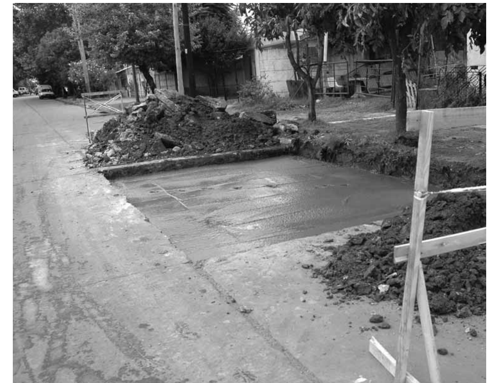
Obras de bacheo en la calle Smith

El mantenimiento de la red de desagües pluviales, un plan de bacheo y la limpieza y parquización en la bajada del acceso Sudeste son algunas de las obras que se están ejecutando en el distrito. También se firmó un acuerdo para la instalación de una red integral de gas natural en los barrios que no cuentan con ese servicio.