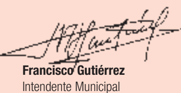
Francisco Gutiérrez Intendente Municipal

Comunicate con nosotros: lahoja@quilmes.gov.ar