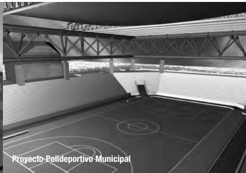
Proyecto Polideportivo Municipal