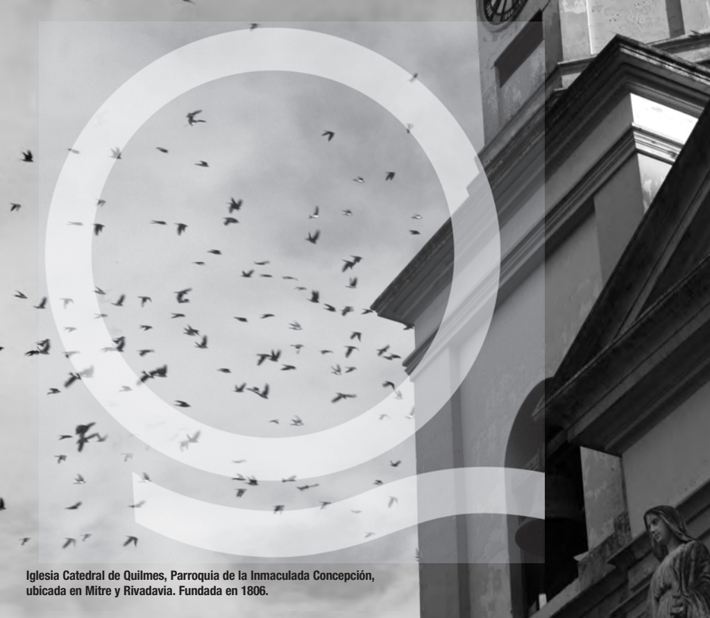
Iglesia Catedral de Quilmes, Parroquia de la Inmaculada Concepción, ubicada en Mitre y Rivadavia. Fundada en 1806.

BOLETÍN MENSUAL DE INFORMACIÓN PARA LAS VECINAS Y LOS VECINOS DE QUILMES AÑO 2 / NÚMERO 22 / DICIEMBRE DE 2009