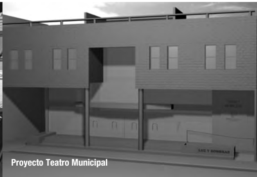
Proyecto Teatro Municipal