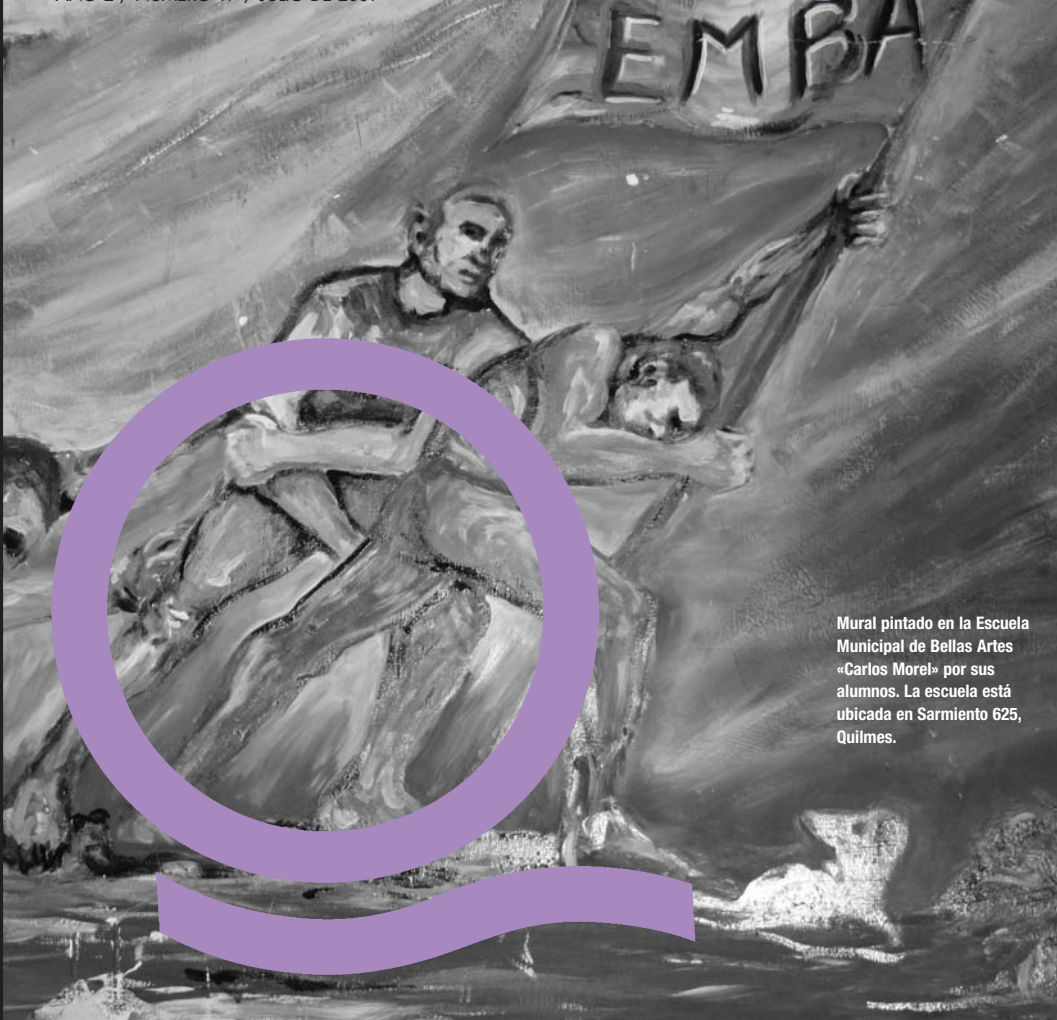
Mural pintado en la Escuela Municipal de Bellas Artes «Carlos Morel» por sus alumnos. La escuela está ubicada en Sarmiento 625, Quilmes.

BOLETÍN MENSUAL DE INFORMACIÓN PARA LAS VECINAS Y LOS VECINOS DE QUILMES AÑO 2 / NÚMERO 17 / JULIO DE 2009