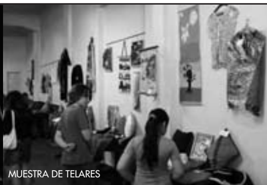
MUESTRA DE TELARES

Todos los domingos 15 hs.: Talleres de títeres. / 16 hs. «El camino de los títeres» , obra para toda la familia. Museo Histórico del Transporte.