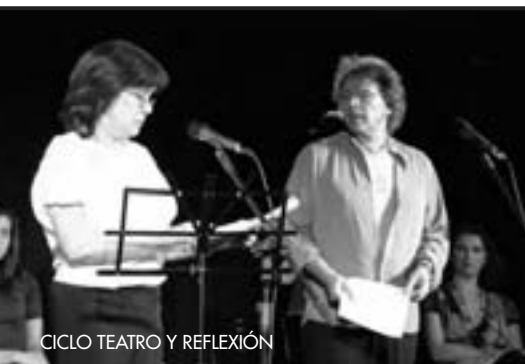
CICLO TEATRO Y REFLEXIÓN