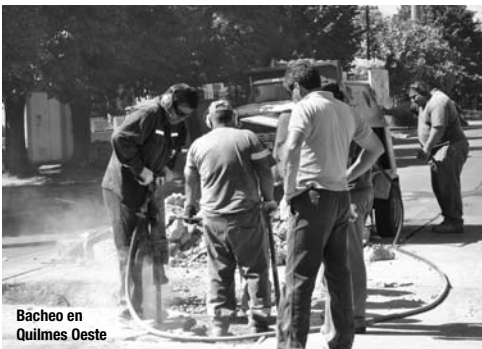
Bacheo en Quilmes Oeste

El Municipio trabaja intensamente asfaltando y reparando las calles de Quilmes. El propósito de realizar 1.000 cuadras de carpeta asfáltica durante este año ya se completó en un 45% (450 cuadras), mientras que desde el inicio de la gestión ya se asfaltaron con hormigón 212 cuadras de un total de 462 que están en marcha.