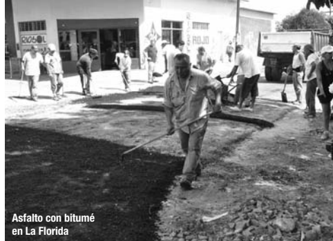
Asfalto con bitumén en La Florida

Vivir sobre una calle de tierra en la ciudad genera un sinnúmero de complicaciones, algunas peligrosas. Salvo que se tenga un vehículo apropiado, es muy difícil trasladarse, ambulancias y bomberos no pueden acceder, la lluvia golpea con más crudeza, los charcos son focos de dengue e infecciones. Este mes avanzamos mucho en el propósito de que no queden calles de tierra en el distrito, inaugurando e iniciando obras de asfaltos en los barrios de La Florida, La Paz, Ezpeleta, Quilmes Oeste y Barrio Los Alamos. También estamos reparando las calles ya asfaltadas, realizando tareas de bacheo y reemplazando desagües para evitar las inundaciones.