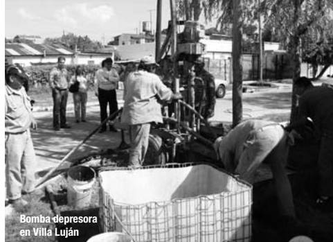
Bomba de presión en Villa Luján