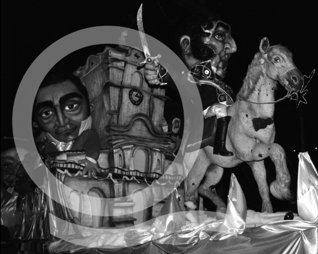
El General San Martín al frente de la Carroza del Bicentenario que engalanó el Carnaval Popular de Quilmes. Marzo de 2011.

BOLETÍN MENSUAL DE INFORMACIÓN PARA LAS VECINAS Y LOS VECINOS DE QUILMES AÑO 4 / NÚMERO 37 / ABRIL DE 2011