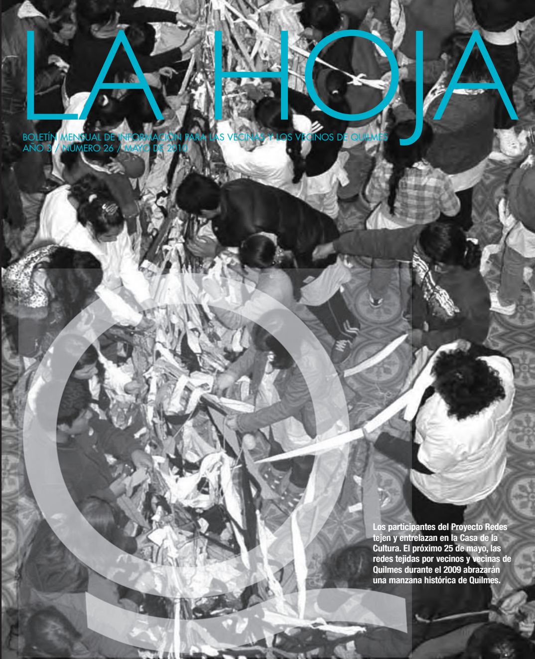
Los participantes del Proyecto Redes tejidas y entrelazan en la Casa de la Cultura. El próximo 25 de mayo, las redes tejidas por vecinos y vecinas de Quilmes durante el 2009 abrazarán una manzana histórica de Quilmes.

Si querés escribir sobre tu barrio o sobre alguna historia de Quilmes en esta columna, o mandarnos una foto de Quilmes, actual o antigua, para ilustrar la tapa, escribinos a lahoja@quilmes.gov.ar o llámanos al 4254 9472