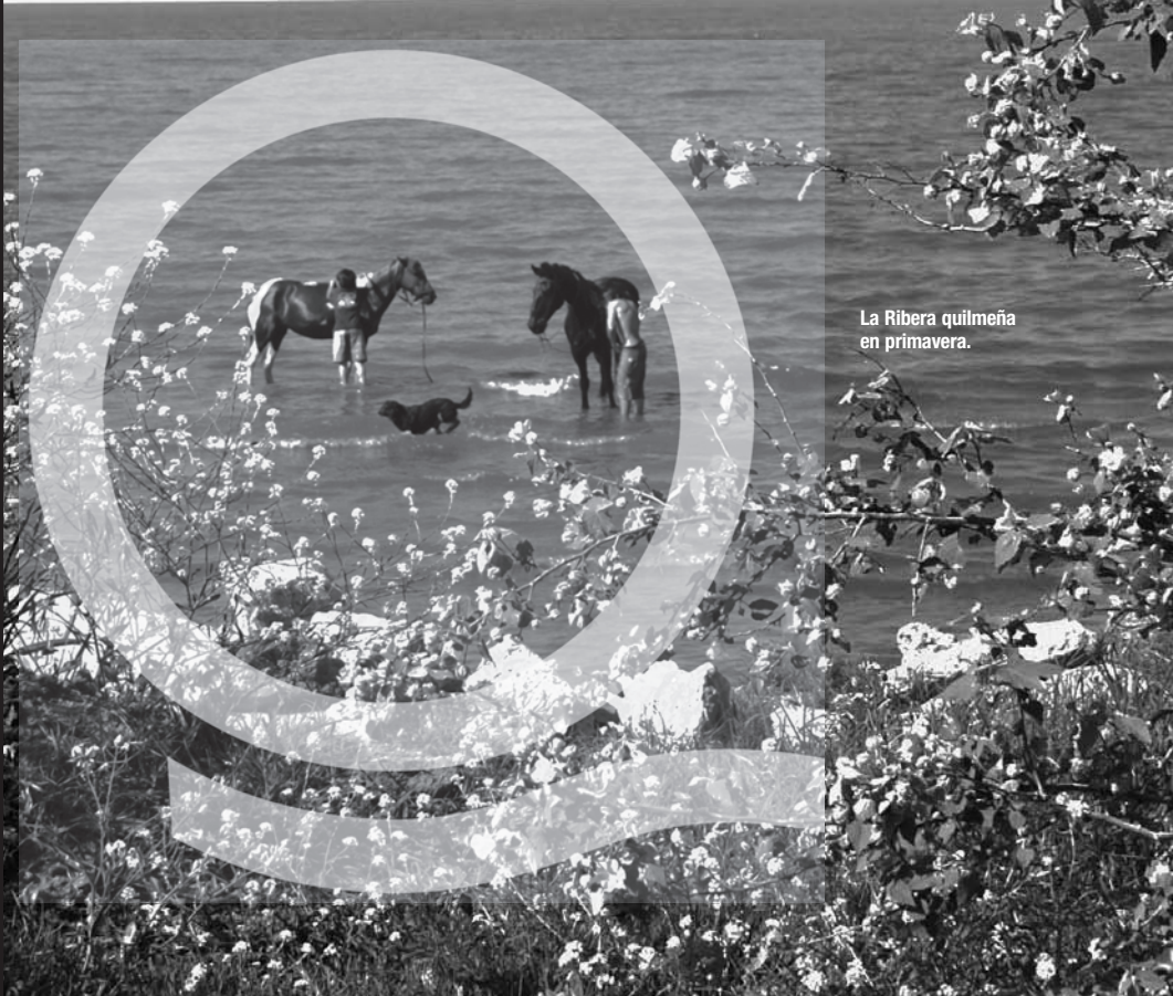
La Ribera quilmeña en primavera.

BOLETÍN MENSUAL DE INFORMACIÓN PARA LAS VECINAS Y LOS VECINOS DE QUILMES AÑO 2 / NÚMERO 21 / NOVIEMBRE DE 2009