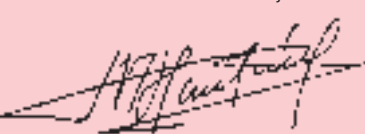
Francisco Gutiérrez Intendente Municipal

Quilmes es grande, y creció de manera despareja. Cualquier propuesta de desarrollo de la ciudad debe partir de una visión equilibrada del conjunto, que contemple tanto el centro como la periferia, y que tenga en cuenta las necesidades y las propuestas de los vecinos. A partir de esta idea, en noviembre estaremos presentando los resultados de las reuniones de la primera etapa del POU (Plan de Ordenamiento Urbano), que contempla las preocupaciones y los aportes de los vecinos para la planificación del crecimiento de Quilmes: la recuperación de la Ribera, la construcción de viviendas, la recuperación de espacios verdes, el polideportivo, el teatro, el nuevo edificio para la EMBA, entre muchas otras cosas. En todo esto estamos trabajando.